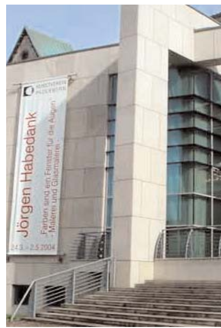
"Farben sind ein Fenster für die Augen" Ausstellung im Kunstverein in der Städtischen Galerie Paderborn ; April/Mai 2004