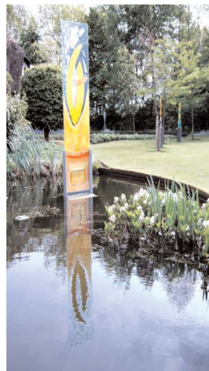
Blick in die Ausstellung " Beelden in Gees " Skulpturenpark der Familie de Hullu hier: Hadedank-Glasstelen in einem der kreisrunden Teiche des 7 ha großen Parkes

Gefällt Euch dieser "Newsletter" aus dem Atelier Habedank? Über Anregungen, Kritik, Beiträge freue ich mich; gerne baue ich das Forum aus. Bitte meldet Euch per mail! Leitet "Das Flügelblatt" gerne auch an Freunde und Interessierte weiter. Ich nehme neue Leser als "Abonnenten" auf - bitte per Mail registrieren lassen! - Ein persönliches (Wieder)sehen oder Kennenlernen ist im Atelier nach telefonischer Vereinbarung immer möglich... Im August lockt das nächste Atelierkonzert und eine Künstlermatinee. Bis denne!