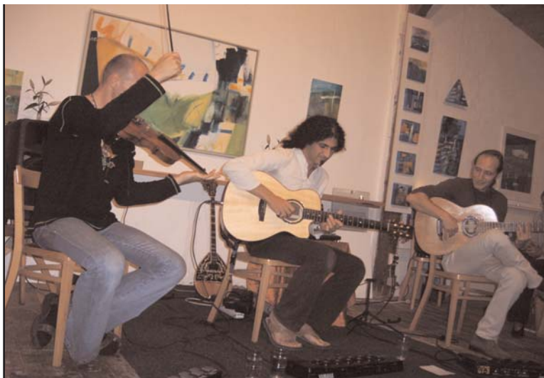
Das Trio "Rangin" am 28.8. im Atelier: Klang, Bewegung, Farbe, Feuer und Virtuosität - große Freude für alle Gäste!

Insgesamt war's eine sehr volle Arbeitszeit - Glasprojekte, Organisation und Malerei haben mich gefordert - aber der künstlerischen Ideen aber sprudelten weiter, das war sehr ermutigend. Ich habe mir Ziele gesetzt, möchte effizienter werden, muß die Kontakte zu Empfehlern ausbauen - mögt Ihr dabei helfen?