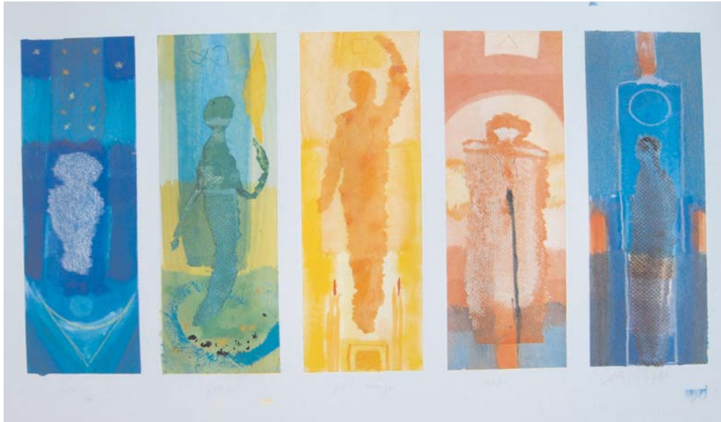
Entwurf der "5 Lebensstufen" Juli/August 2004 Arbeit für einen Bestattungsunternehmer in Arnberg Originalgröße der Malereien auf Leinwand: je 170 x 50 cm Gestaltung an einem wichtigen Ort!