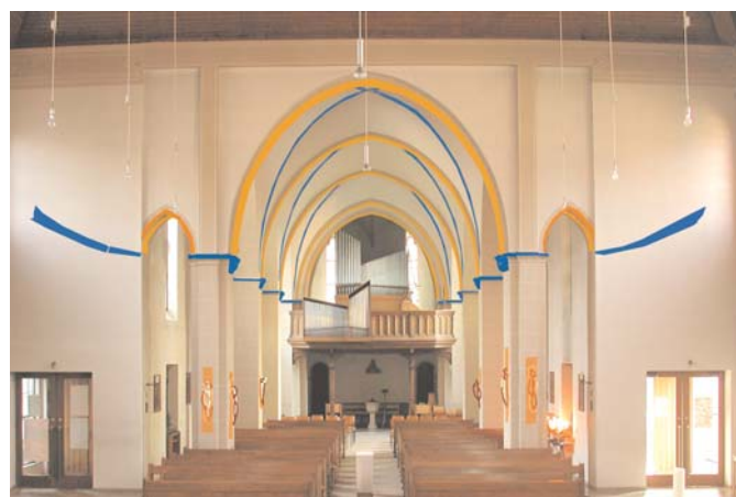
Computersimulation der Farbfassung im alten Teil der Kirche