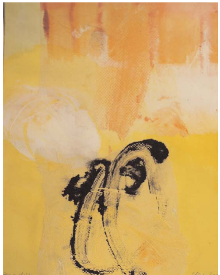
"Zen im Licht"

Acryl + Collage auf Papier 40 x 30 cm 2006 (520,- €aufgezogen auf Holz)