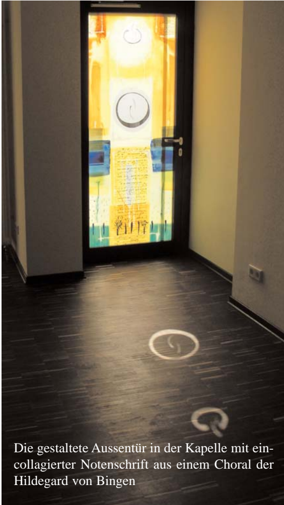
Die gestaltete Aussentür in der Kapelle mit ein-collagierter Notenschrift aus einem Choral der Hildegard von Bingen