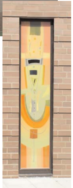
Das Sakristeifenster von außen (oben) und von innen (unten)