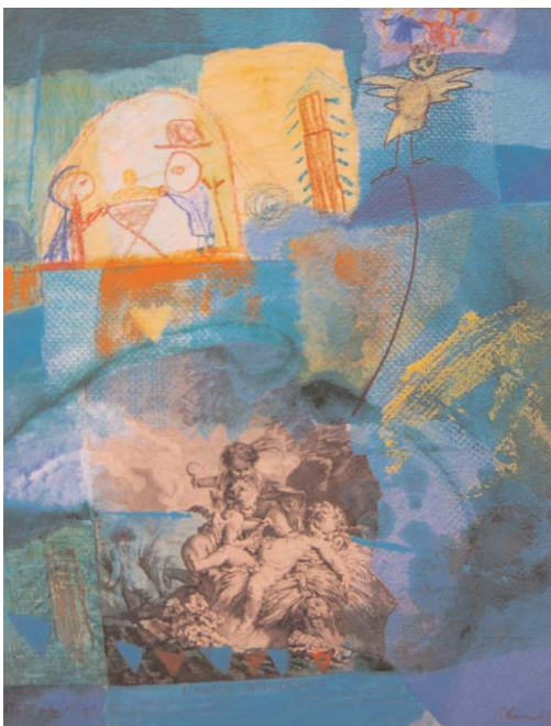
zwei Beispiele von den “Sonntagsbildern” ...