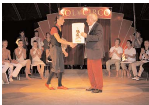
Bei der Preisverleihung: ein Sponsor überreicht einen der Preise