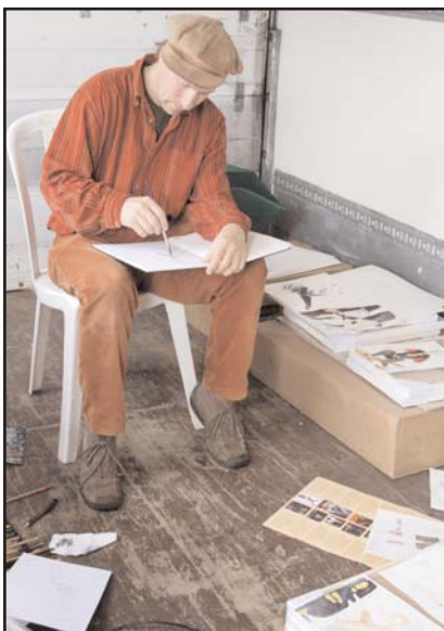
Beim Zeichnen im Circuscontainer ...